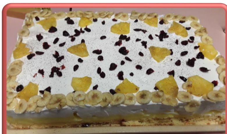
Gâteau d'anniversaire fait par nos cuisiniers